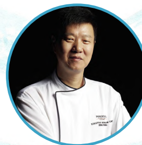
ZENG FENG Si Chuan Dou Hua Restaurant *