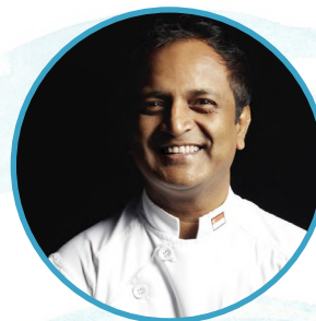
MANJUNATH MURAL ADDA Restaurant