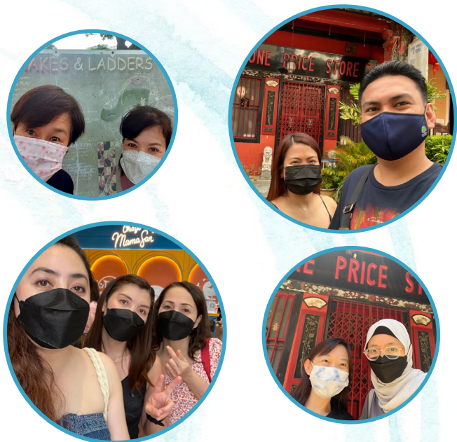
参赛者在各比赛站点完成他们的挑战。