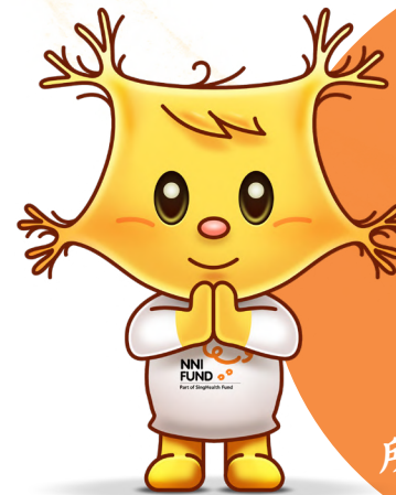
丹尼 国立脑神经医学院 保健基金大使